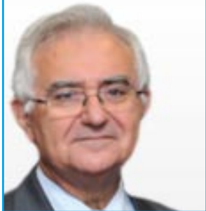
Santé et politique des consommateurs