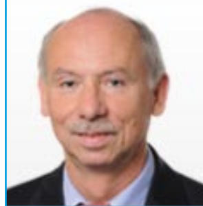
Programmation financière et budget