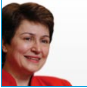
Coopération internationale, aide humanitaire et réaction aux crises