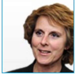
Action pour le climat