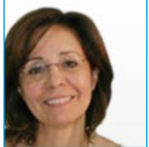
Affaires maritimes et pêche