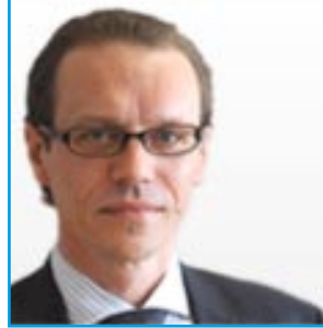
Fiscalité et union douanière, audit et lutte antifraude