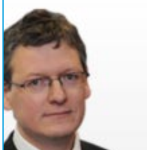
Emploi, affaires sociales et inclusion