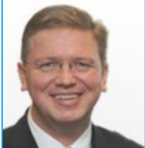
Élargissement et politique européenne de voisinage