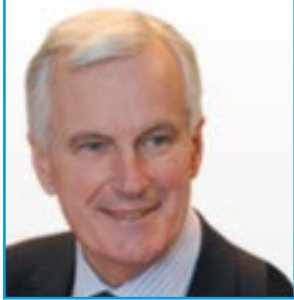
Marché intérieur et services