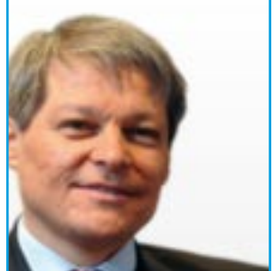
Agriculture et développement rural