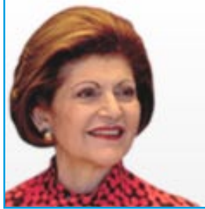
Éducation, culture, multilinguisme et jeunesse